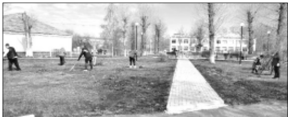
В Святославке жильцы многоквартирных домов провели субботник.

На уборку общественных территорий вышли депутаты сельского Совета, работники администрации и учреждений социальной сферы, волонтеры. В порядок приведены территория памятника участникам Великой Отечественной войны, аллея Памяти, парк, уличная сцена, клумбы. Марафон чистоты будет продолжен.