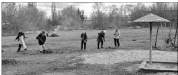
График приема граждан депутатами всех уровней, представителями исполнительной власти, общественных организаций, членами и сторонниками Самойловского местного отделения партии «Единая Россия» на апрель 2025 года

Жители многоквартирных домов по улице Коммунистической в с. Святославке провели первый весенний субботник. Сельчане навести порядок на придомовой территории и общественной территории – детской площадке.