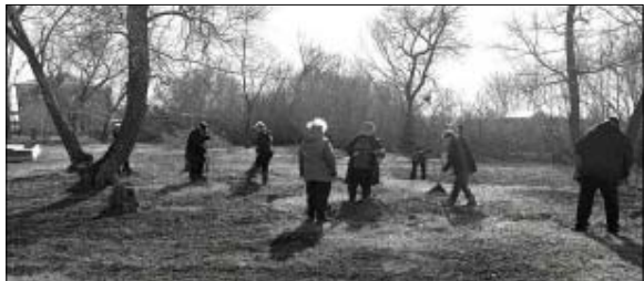
В п. Краснознаменском прошел первый субботник.

На уборку общественных территорий вышли социальные работники, работники Дома культуры, библиотеки, администрации, неравнодушные жители села. В порядок приведена территория парка у памятника участникам Великой Отечественной войны, сад Памяти.