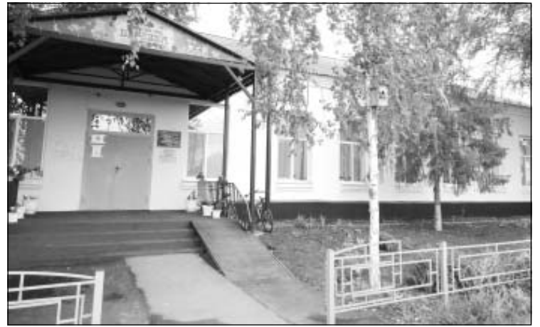
кольное учреждение, говорят: «Хорошо у нас в саду!» И это так: в детском саду тепло, светло, уютно, глаз радуют обновленный фасад здания и благоустроенная территория вокруг.

Дошкольники большую часть дня проводят в детских садах. После проведенных ремонтов условия для пребывания детей значительно улучшены, чему очень рады родители. Ребята, приходя каждое утро в дош-