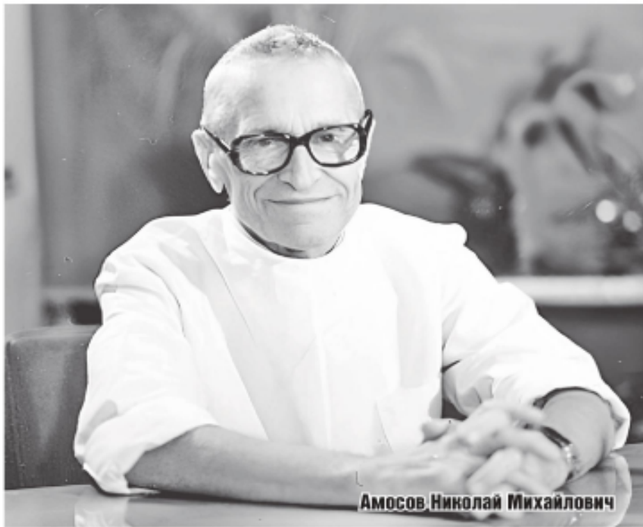
Амосов Николай Михайлович

— Из неопубликованных дневников Николая Амосова, 1989 г.