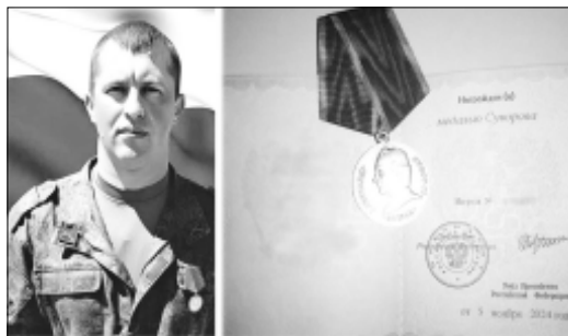
Андрей Д. из Дергачевского района отмечен государственной наградой.

За проявленные мужество и отвагу в ходе СВО бойца наградили медалью Суворова. Об этом сообщили в администрации муниципалитета.