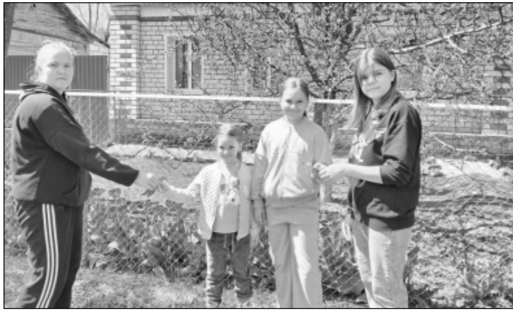
мени, мужества и Великой Победы. Учащиеся Полоцкой школы присоединились к Всероссийской акции «Георгиевская ленточка». Эта акция посвящена 81-й годовщине Победы в Великой Отечественной войне. Главное – не просто повязать ленту, а вспомнить тех, кто подарил нам мирное небо.

Георгиевская лента – символ воинской славы, памяти и уважения к подвигу защитников Родины. Главный слоган акции – «Я – помню! Я – горжусь!». Чёрно-оранжевые цвета – символ дыма и пла-