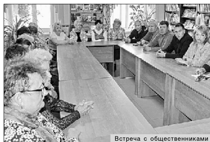
Встреча с общественниками

бирателей: о росте тарифов за коммунальные услуги, о принятии закона о «детях войны», о работе Общественной приемной партии «Единая Россия» с обращениями граждан.