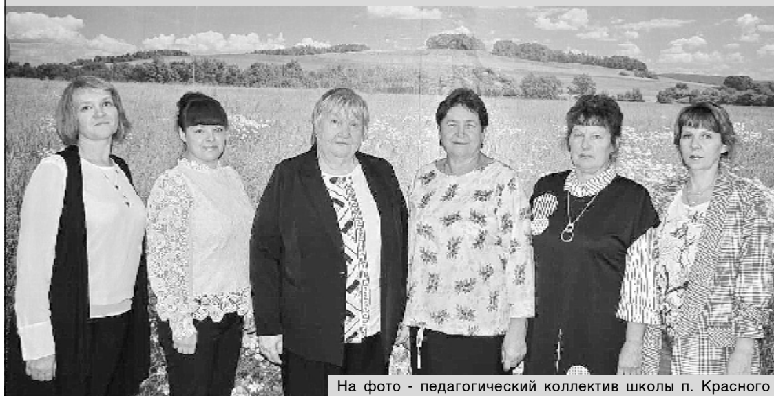
На фото - педагогический коллектив школы п. Красного

Дорогие учителя! Поздравляю вас с профессиональным праздником!