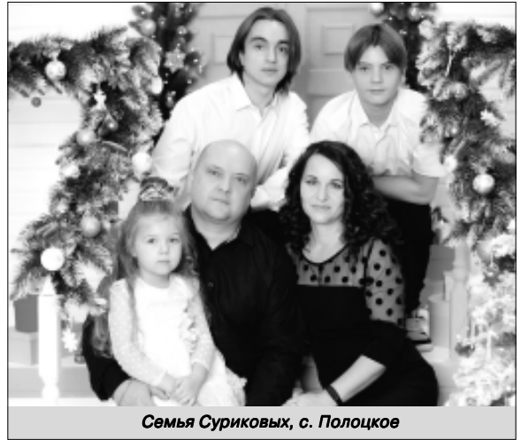
Семья Суриковых, с. Полоцкое

УВАЖАЕМЫЕ ЧИТАТЕЛИ! ЗАКАНЧИВАЕТСЯ ВСЕРОССИЙСКАЯ ДЕКАДА ПОДПИСКИ, когда стоимость подписки на газету «Земля Самойловская» снижена и составляет 415,02 руб. Выписать печатное издание можно на почте или в редакции газеты. Оставайтесь с нами!