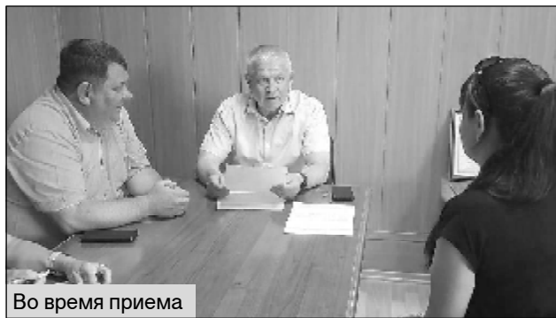
Во время приема

Виктор Борисович Кидяев – депутат Госдумы, член комитета по экономической политике, председатель Высшего совета национальной ассоциации развития местного самоуправления – не впервые в Самойловском районе с официальным визитом. Традиционно визит начинается с приема граждан.