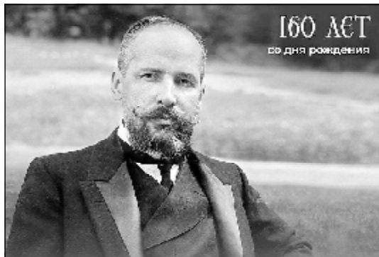
160 ЛЕТ со дня рождения

«За время своего губернаторства Столыпин преобразил Саратов, дал ему мощный импульс развития. Многих поразила и его работоспособность. Отмечали его умение глубоко вникать в любую проблему, решать ее», — написал Вячеслав Володин о Столыпине в журнале «Историк».