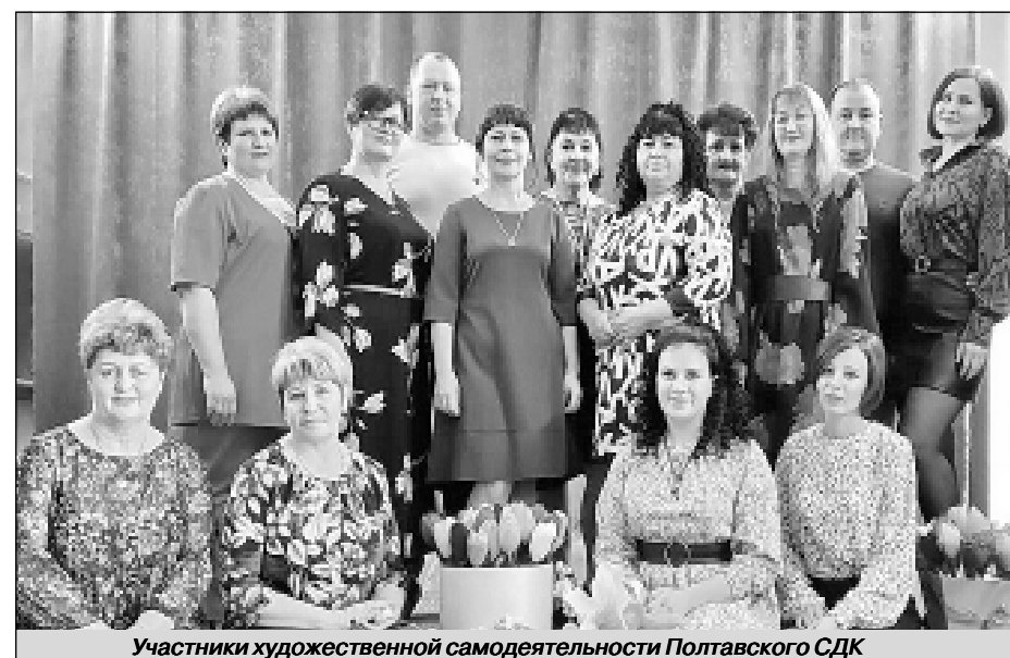
Участники художественной самодеятельности Полтавского СДК

самбля «Надежда». Диплом лауреата III степени на II Всероссийском конкурсе казачьей культуры «Воронежская застава» получил ансамбль «Разгуляй». Ансамбль «Надежда» принял участие в областном фестивале-конкурсе эстрадной музыки «Новобураские аккорды» и завоевал Диплом I степени. На международном конкурсе «Хрустальное сердце мира» народный коллектив «Надежда» получил сразу несколько наград: Диплом Гран-при, специальный приз от председателя жюри и Диплом за высокое мастерство. Достоинно выступили наши культработники и в конкурсе ведущих раз-