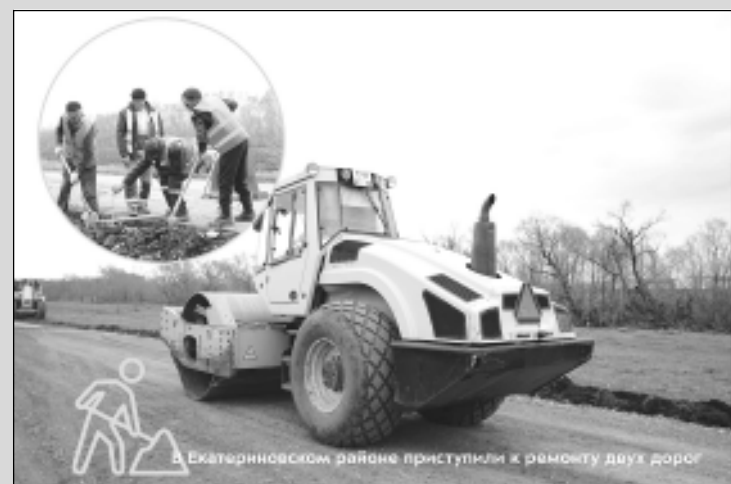
В Екатериновском районе приступили к ремонту двух дорог

Всего в этом году по нацпроекту «Безопасные качественные дороги» планируется привести в нормативное состояние 320 км трасс и 13 мостов и путепроводов.