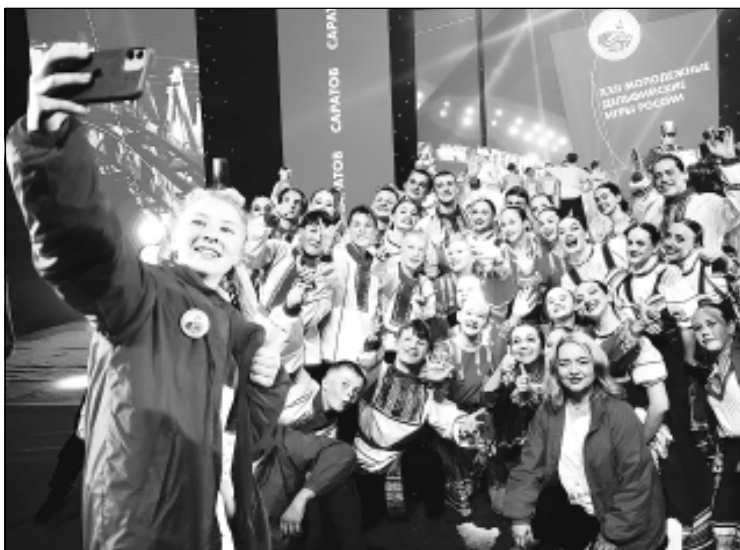
В Саратове завершились XII молодежные Дельфийские игры России.

В Саратовском государственном цирке имени братьев Никитиных состоялись торжественная церемония закрытия игр и гала-концерт. На протяжении всех конкурсных и фестивальных дней участники игр состязались в дисциплинах художественного, прикладного и научно-исследовательского творчества.