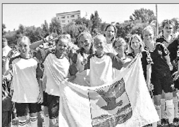
шено установить спортплощадки в районах, где занимаются мальчики и девочки.