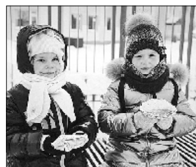
Всероссийская акция пройдет с 20 по 26 февраля и станет частью проекта «Культура для школьников».