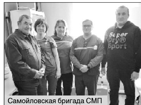
Самойловская бригада СМП