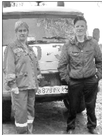
Хрущевская бригада СМП

В Самойловском районе работают пять бригад скорой медицинской помощи, где трудятся очень ответственные и самоотверженные люди. Это фельдшеры скорой медицинской помощи, медицинские сестры по приему вызовов и передачи их выездным бригадам, водители автомобилей. У сотрудников бригад скорой помощи всегда готовы укладки, которые наполнены необходимыми медикаментами.