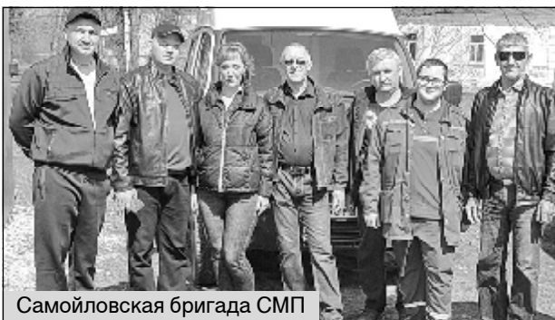
Самойловская бригада СМП