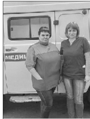
Святославская бригада СМП

Медики утверждают, что работать в этой профессии можно в том случае, если человек любит помогать людям и применяет свои умения на деле.