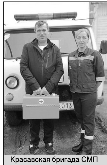
Красавская бригада СМП