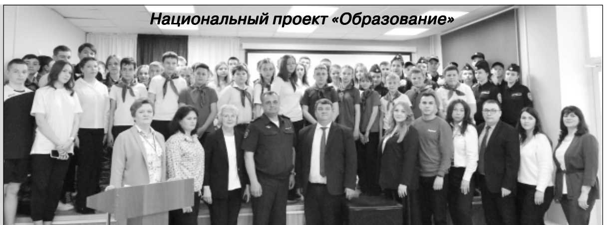
Национальный проект «Образование»

Согласно памятке, разработанной антитеррористической комиссией в Саратовской области, в случае обнаружения беспилотного воздушного судна жители области просят сообщать в правоохранительные органы.