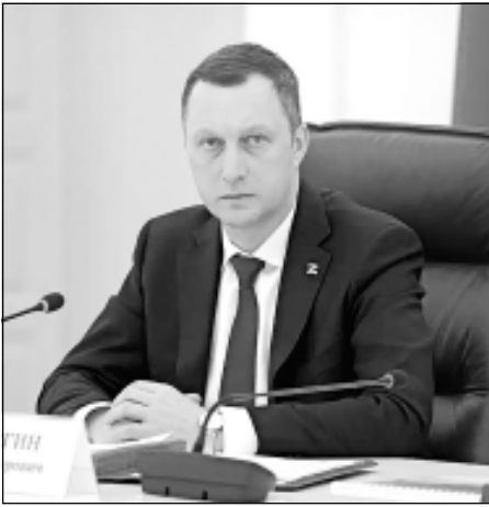
Губернатор Роман Бусаргин провел постоянно действующее совещание с зампредами правительства, министрами и руководителями ведомств, а также главами районов.

Как было озвучено, планируется открыть более 20 муниципальных пляжей. Профильные службы готовятся к предстоящему официальному старту купального сезона.