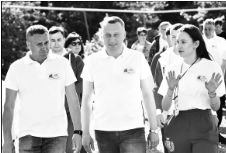
В соревнованиях принимают участие 17 команд: сборные всех регионов ПФО, а также Беларуси, Казахстана и Узбекистана.