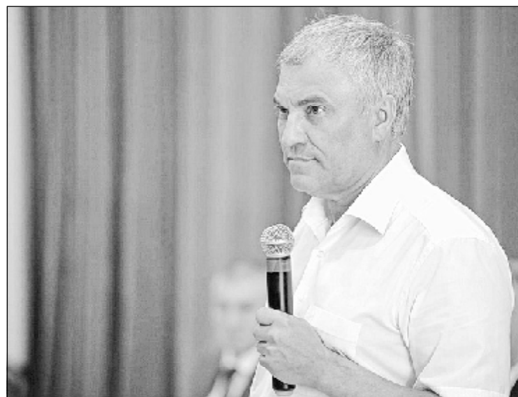
в рамках соответствующих региональных программ, а между тем многие главы районов не в состоянии качественно подготовить проектную документацию.

В ходе встречи ее участники подняли тему финансовой обеспеченности полномочий муниципалитетов. Вячеслав Володин напомнил, что много полномочий в последние годы переданы от муниципалитетов на областной и федеральные уровни – это здравоохранение, дороги и т.д., а чиновников меньше не стало. Но транспортный налог, например, отдали в районы, а ремонт школ и ДК занимается область