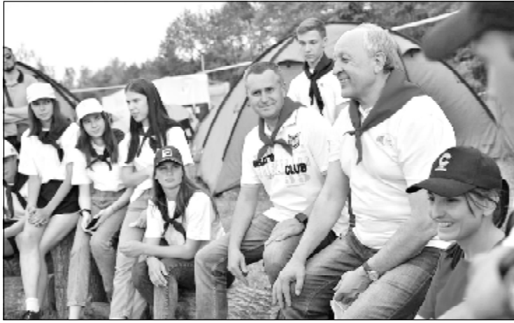
высшего образования Приволжского федерального округа, обучающиеся по специальности

В Хвалынске стартовал спортивно-туристский лагерь Приволжского федерального округа «Туриада-2021», который проходит под патронатом полномочного представителя Президента в ПФО Игоря Комарова.