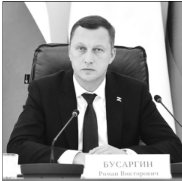
уже на полигон, – высказался глава региона. Губернатор также отметил, что уже сейчас должно быть понимание, где будут брать дополнительную технику на случай сильных снегопадов.

– Чтобы выехать за город, технике понадобится минимум час. К примеру, днем сгрузили снег в места временного хранения, ночью его оттуда увезли