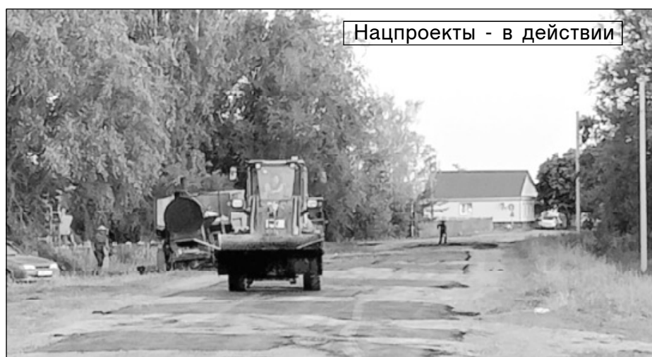
Нацпроекты - в действии

В нынешнем году на Красавское муниципальное образование выделены из областного бюджета более 6 млн рублей, благодаря чему отремонтирован километр дороги от въезда в село со стороны Самойловки до моста, а теперь на сэкономленные средства ремонт дороги продолжен – от моста в сторону автозаправочной станции. Отлично, что каждая инициатива земляка-единоросса В.В. Володина направлена на решение важных социальных проблем сельчан.