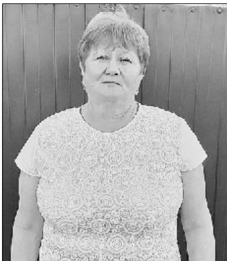
Призвание этой женщины – дарить людям, нуждающимся в помощи, добро и частицу своей души.